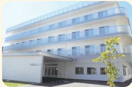
真愛あらたホーム