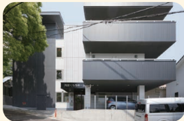
真愛くもちホーム