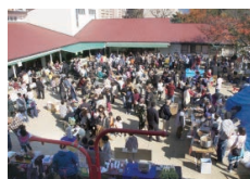
愛隣館研修センター