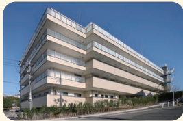
真愛たきやまホーム