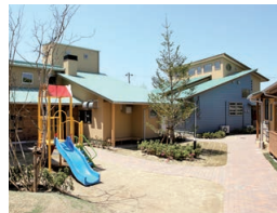
ガーデンエル・ロイ

すべての子どもが「生まれてきてよかった」と心から言える社会を求めて、困難な環境で過ごす子どもたちを健やかに育む施設です。家庭復帰のための支援や里親の受け入れ推進などの活動も行っています。