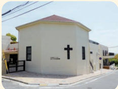
ぶどうの木保育園