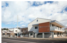
かがわ子ども子育て支援センター 育愛館（保育園） 神愛館（乳児院）

未就園の乳幼児や、その保護者を対象に、交流の場の提供や、育児相談・講習会・他機関とのコーディネートを行い、地域の子育て力の向上に努めています。