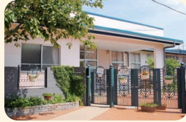
宇山光の子保育園