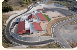
みなべ愛之園こども園