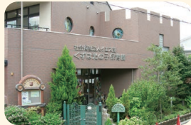
くずは光の子保育園